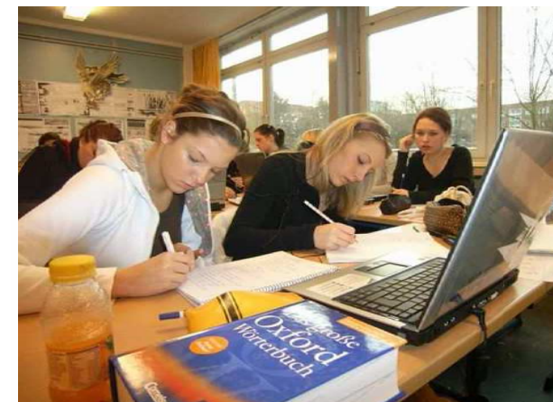
Schülerinnen der Themenklasse Kommunikation bei der Arbeit am FFB

INFORMATIONEN FÜR SCHÜLER, ELTERN UND LEHRER